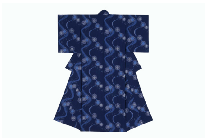
『夢花火』 1995年・第42回日本伝統工芸展入選作品

久留米市の全国総本山「水天宮」は安徳天皇とその生母を祀ることから、こどもの守護神として広く知られる。