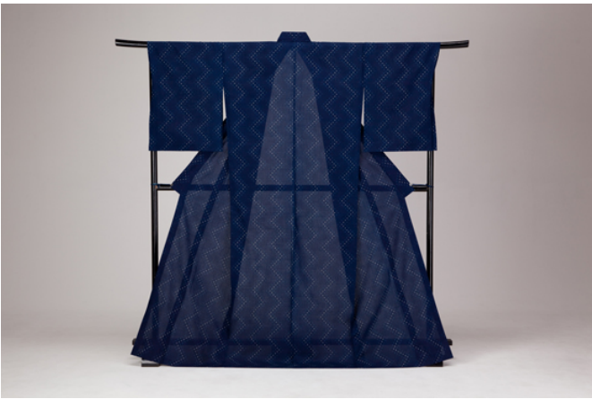
久留米上布「星のさやか」