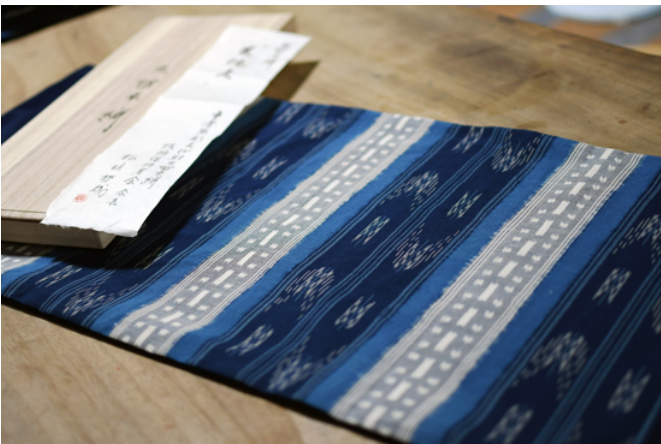
テーブルセンター 「麦穂文」