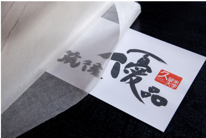
八女津薄紙「俊芸紙」 64×97cm