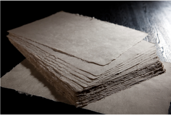
賞状用紙 約A3サイズ